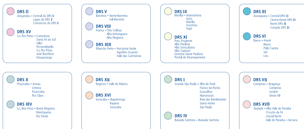
Figura 2: Distribuição das redes de atenção à saúde do estado de São Paulo participantes do projeto de gestão da clínica nas redes, Instituto Sírio-Libanês de Ensino e Pesquisa, 2009.

O envolvimento desse primeiro conjunto de redes de atenção à saúde representa uma iniciativa de apoio à ação transformadora dos sujeitos voltados à construção de projetos e à massa crítica relevante para a multiplicação da experiência acumulada.