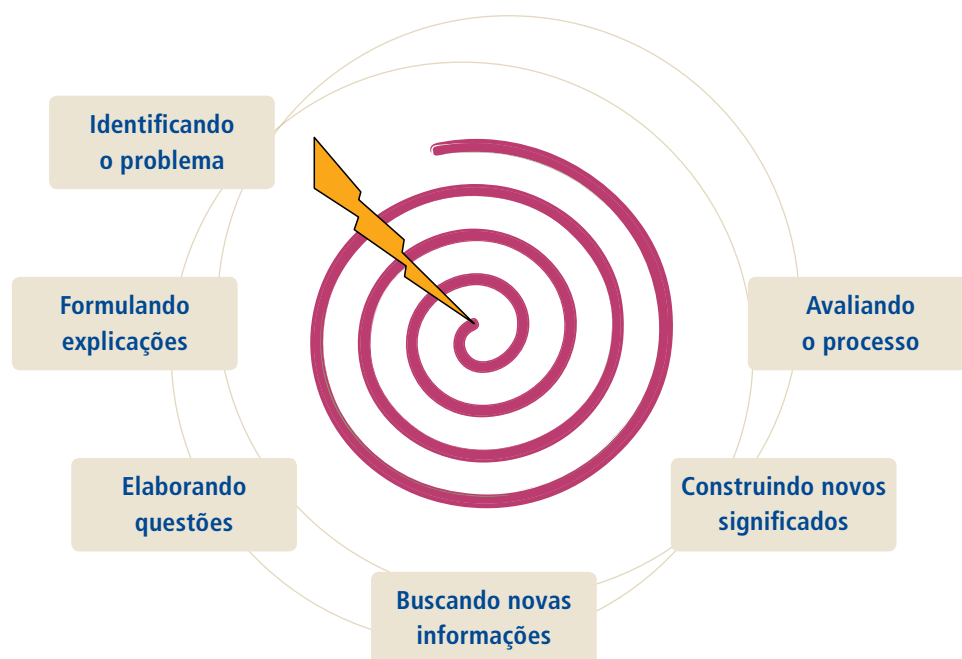
FIGURA 4 3 Espiral construtivista do processo de ensino-aprendizagem a partir da exploração de um disparador.

Durante o programa, os participantes terão oportunidades de desenvolver novas capacidades na interação: com professores, consultores, participantes, expositores e coordenadores. A articulação entre a abordagem construtivista, a metodologia científica e a aprendizagem baseada em problemas 2 é apresentada de modo esquemático na Figura 4.